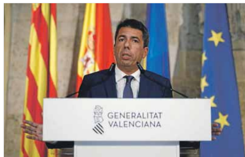
Carlos Mazón, gneu representant de les classes dirigents alacantines

Com a cosa positiva, estic convençut que la major part dels valencians, tinguen la ideologia que tinguen, ja no comparteixen que el seu