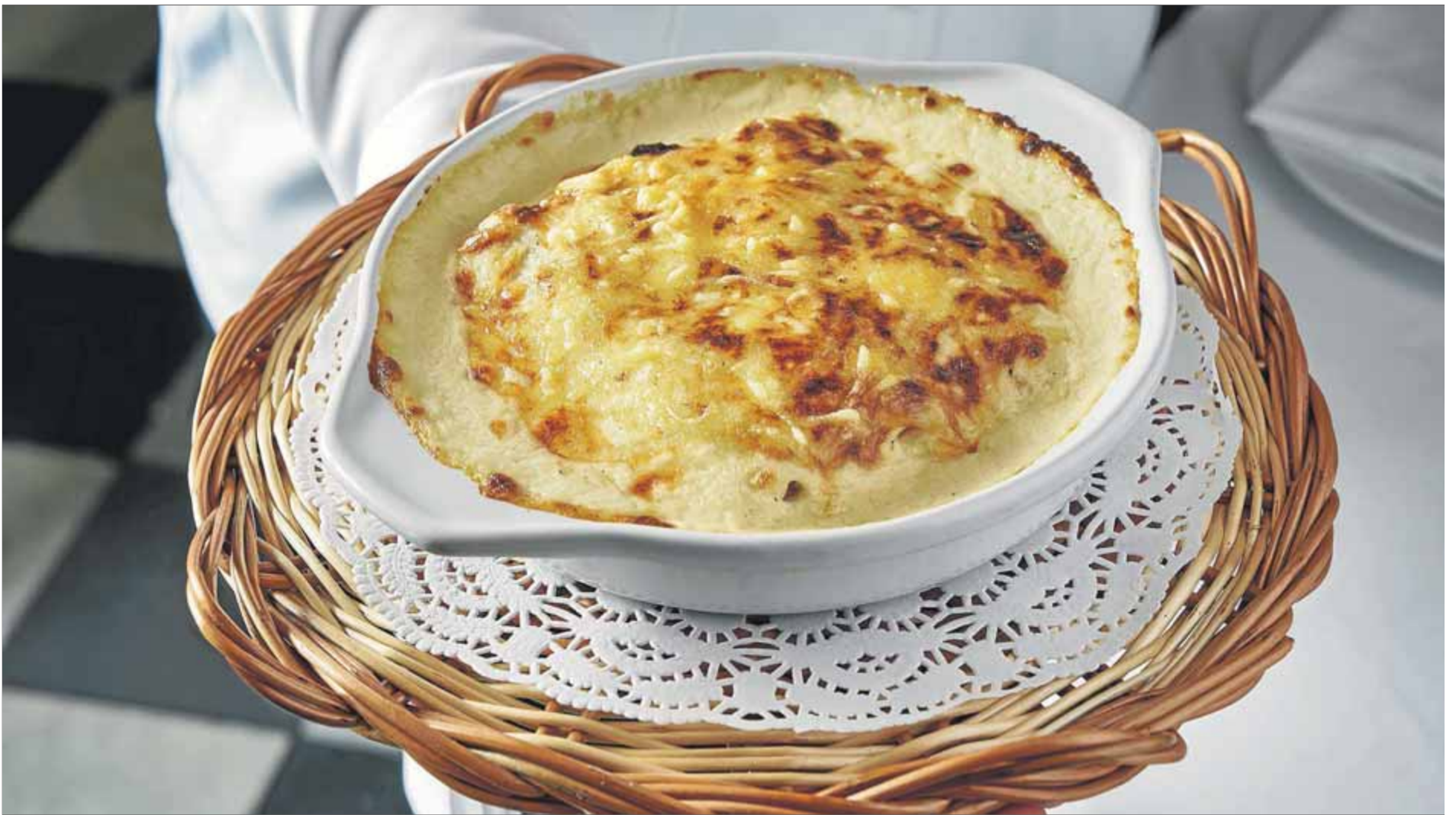
Els canelons, el plat típic que es menja per Sant Esteve, originàriament per aprofitar la carn que havia sobrat del dia de Nadal. Aquí, els del 7 Portes (obert des del 1836) ■ 7PORTES