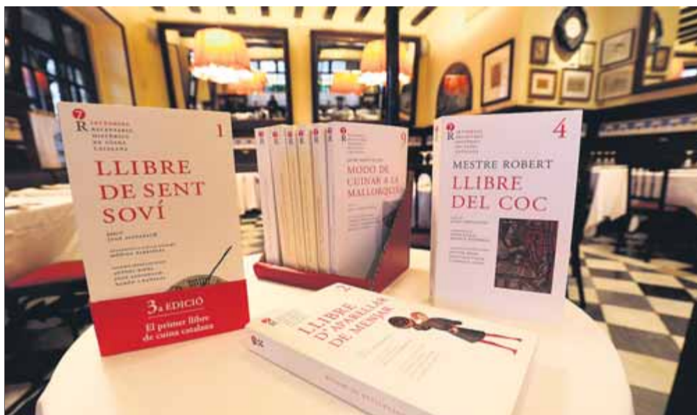
La Col·lecció 7 Portes de Receptaris Històrics de la Cuina Catalana ■ JUANMA RAMOS

La Col·lecció 7 Portes de Receptaris Històrics de Cuina Catalana (Editorial Barcino) és la història de la cuina catalana des de l'edat mitjana fins al segle XX. Una col·lecció dels receptaris històrics amb explicacions introductòries d'experts historiadors i investigadors de la història de la cuina. De moment van pel novè volum, que ha sortit aquest 2024: 'Modo de cuinar a la mallorquina' de Fra Jaume Martí. Els vuit volums anteriors són: 'La cuina dels carmelites descalços', de Francesc del Santíssim Sagrament; 'La cuina dels cartoixans. Costumaris d'Escaladei i de Montalegre', d'autor anònim; 'L'art de la cuina', de Fra Francesc Roger; 'Avisos i instruccions per lo principiant cuiner', anònim; 'Llibre de coc', del mestre Robert; 'Llibre de totes maneres de potatges', anònim; 'Llibre d'aparellar menjar', també anònim, i, també anònim, el 'Llibre de Sent Soví'.