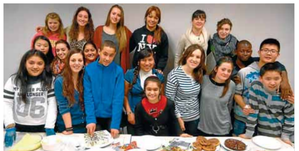
Els joves que van participar al taller de cuina, una de les activitats de l'Espai Ideal ■ J.C.

rectament a l'ideal o a través de la pàgina web ideal.ot.cat. És una de les activitats de la nova temporada de l'Espai Ideal, juntament amb moltes altres, com ara el taller de cuina dels joves participants al projecte de mentoratge Rossinyol. ■