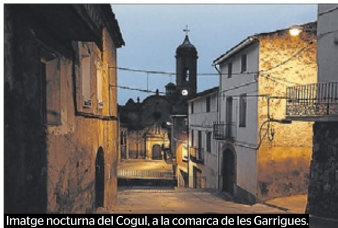
Imatge nocturna del Cogul, a la comarca de les Garrigues.