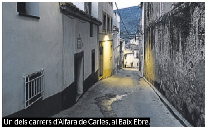
Un dels carrers d'Alfara de Carles, al Baix Ebre.