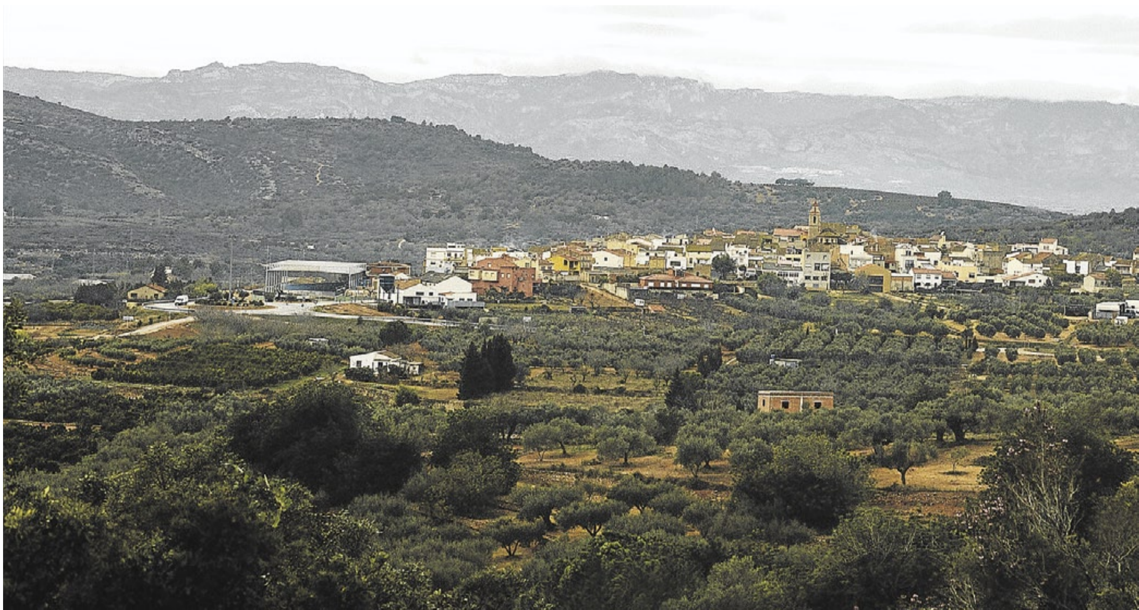
Vista panoràmica del poble de Freginals, de poc més de 400 habitants, situat a la comarca del Montsià.