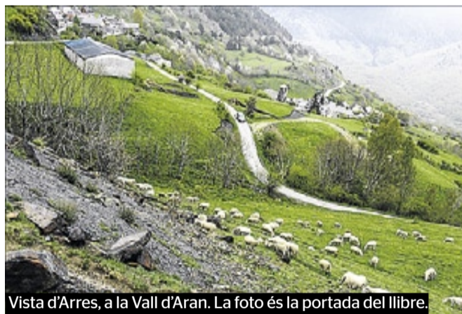
Vista d'Arres, a la Vall d'Aran. La foto és la portada del llibre.