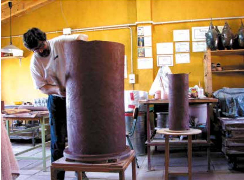
El taller la Moixera a Reus. Any 2009