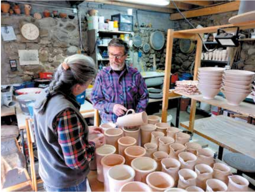
El taller d'Angostrina