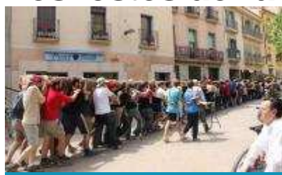
Festes de l'Arbre