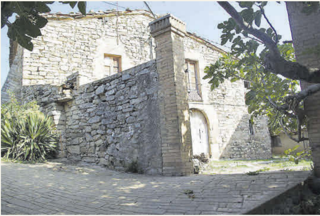
El mas antic de can Padrisa, a Moià